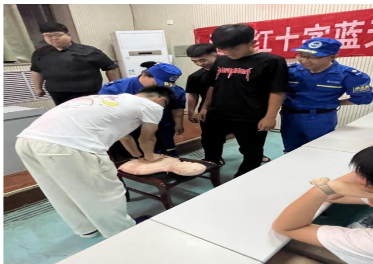
图 2-5:邀请沧州红十字蓝天救援队到校讲授应急救护知识