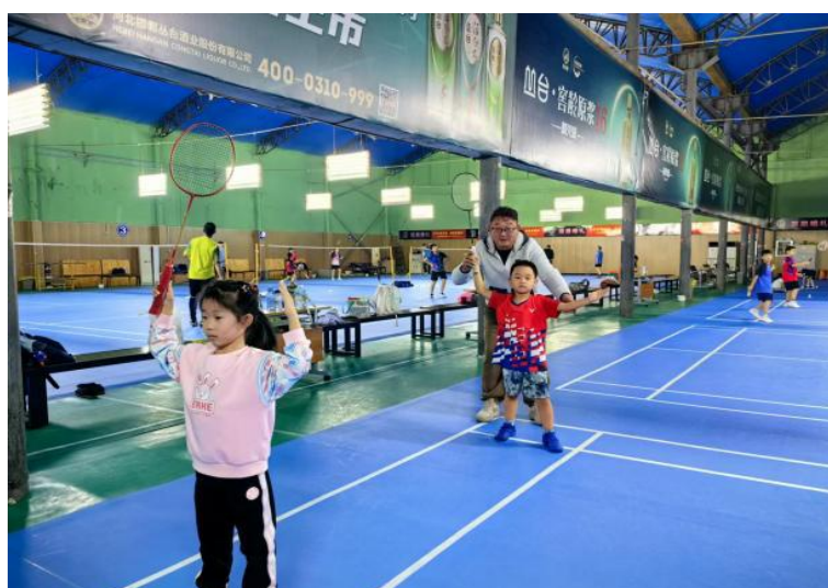
图 4-2:羽毛球项目培训