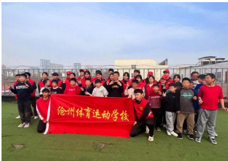
图 2-6:开展“小桔灯”助残帮扶活动