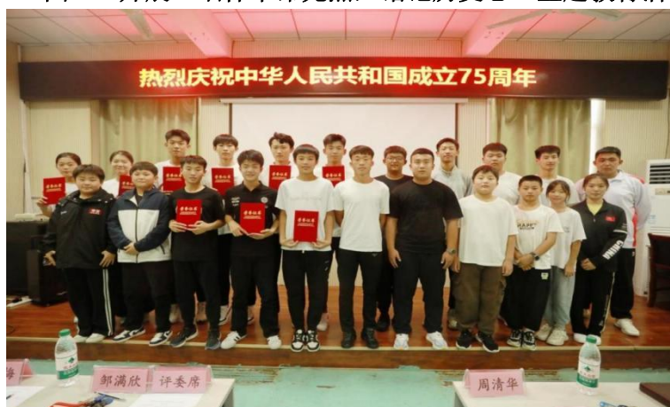
图 2-4:举办“强国有我心向党，红歌嘹亮颂华章”歌咏比赛