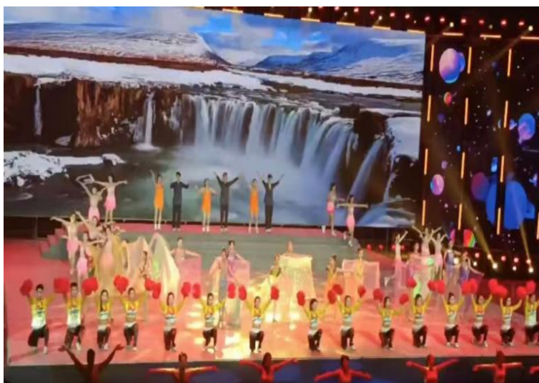
图 4-5:学校艺术体操队参加沧州师范学院运动会开幕式演出