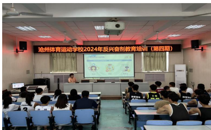
图 7-2:学校反兴奋剂教育培训