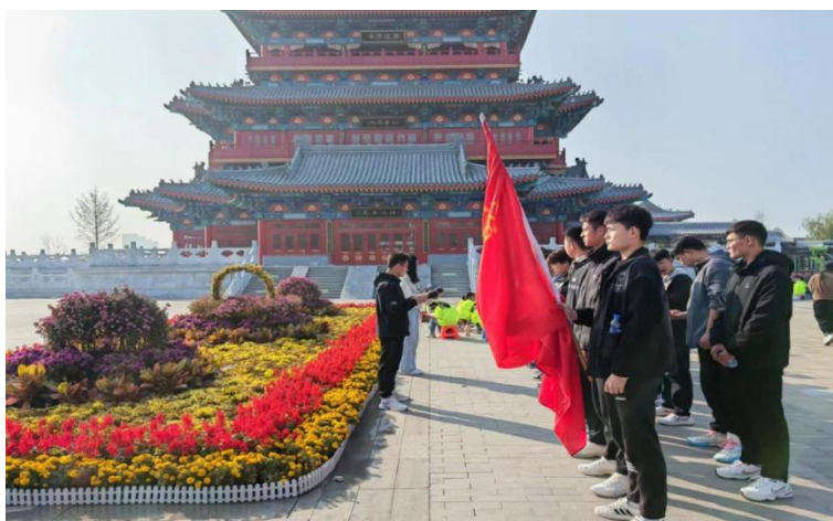
图 5-3:学校开展“守护历史文化的根与魂”活动