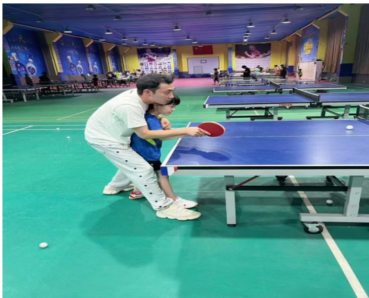
图 4-3:乒乓球项目培训