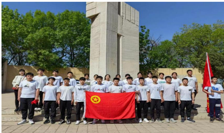
图 5-1:学校开展“缅怀革命先烈 继承革命遗志”爱国主义教育活动

教育活动，引导学生牢记历史使命，树立远大志向，培育良好品德，成为有理想、有道德、有纪律、有作为的时代新人。激励运动员学生在新长征路上，激昂斗志，挥洒青春，奉献力量，为国争光。