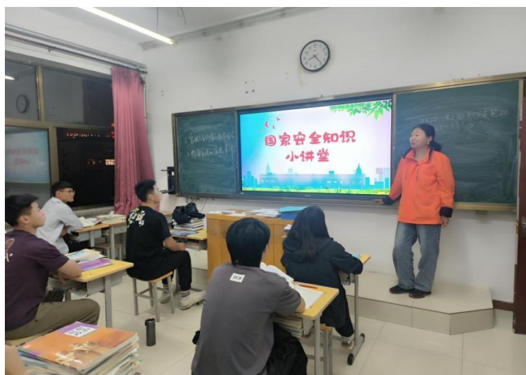
图 7-1:国家安全教育日主题班会

7.2.3 落实安全防范措施。 全年，按照全市安全生产工作部署，围绕消防、交通出行、建筑施工、食品、燃气5个领域和赛事活动、训练备战、体育场馆、器材设施、学生霸凌打闹、兴奋剂、吸烟、早恋等8个体育学校特有领域安全工作，开展了数次风险隐患排查整治，1次应急疏散演练，各科室协调联动，整体推进各项安全工作，成效明显。全年，学校还组织各科室学习河北省《安全生产工作条例》《平安建设条例》《体育领域重大事故隐患排查标准》，组织开展了全民国家安全教育日、保密安全宣传月、反兴奋剂教育培训等活动，建立健全安全管理体系，完善制度规定，扎紧全员安全防线。