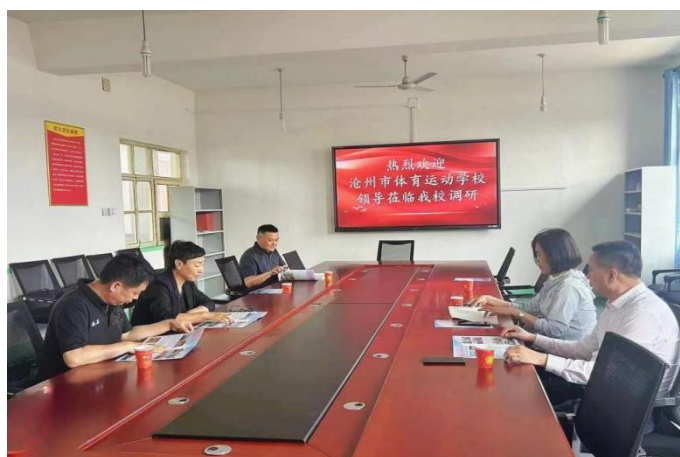
图 7-3:校领导赴献县校区调研

今年 2 月，学校与献县教体局达成合作意向，在献县第三中学设立献县校区。这是学校响应国家大力发展职业教育、培养更多专业技能型人才号召，利用自身优质体育资源，为有体育特长的学生开辟成长新路径的又一创新之举。两校联合办学，弥补短板，相互借力，既扩大了影响，又拓宽了学生成才渠道，必将产生良好影响和积极的带动作用。