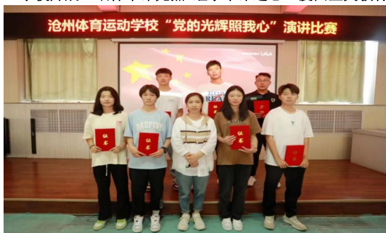
图 5-2:学校开展“党的光辉照我心”演讲比赛