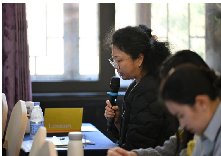
图 3-9:学校教师参加河北省体校文化课教师教学技能培训