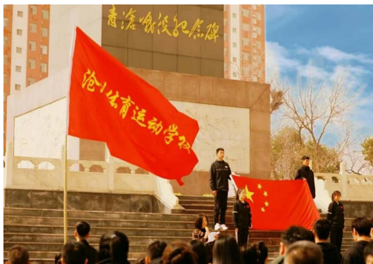
图 2-3:开展“缅怀革命先烈，铭记历史志”主题教育活动

余次，累计参加志愿者服务活动 80 人次，多名学生获团市委表彰，德育教育结出丰硕成果。