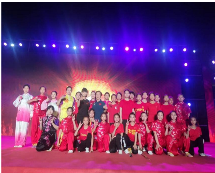
图 4-6:学校武术队在南川老街进行专场表演