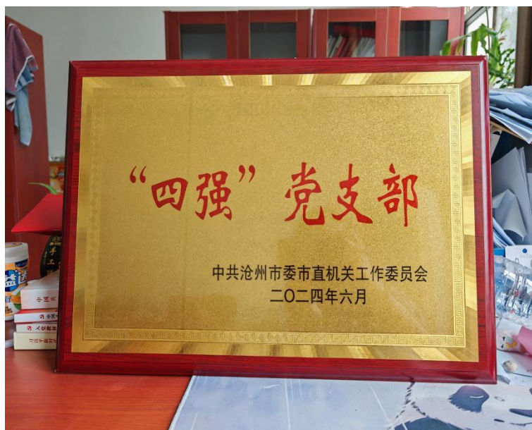
图 2-2:行政支部获全市“四强党支部”称号

政治工作基础。全面规范和组织实施党组织三会一课、多彩主题党日、党员理论学习等，规范建强了各级党团组织设置，积极谋划“党建十”工程，推动党组织工作全覆盖；严格党委中心组理论学习，严格党员领导干部参加双重组织生活制度，积极开展服务型党组织、“四强党支部”创建活动，实现对标强基础，提升出亮点，巩固上品牌，实现了各级党组织建设的全面进步、全面过硬。今年，3名入党积极分子加入党组织，行政支部获全市“四强党支部”称号。在校党委的团结带领下，全校干部职工认真贯彻落实党的路线、方针、政策，努力完成了教书育人、训练比赛、人才输送、学校建设、内部改革等各项任务，使学校办学质量、办学效益和办学水平不断提高。